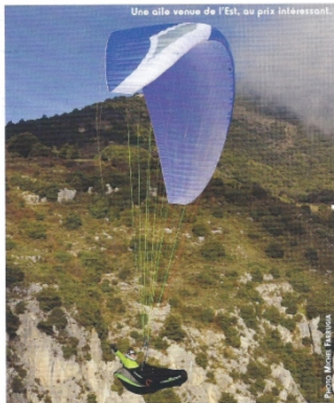
Une aile venue de l'Est, au prix intéressant.

J'ai revolé depuis en thermiques, au nuage dans une jolie confluence sur Roquebrune Cap Martin, dans des conditions bien différentes, plus douces et régulières. La Scorpion 4 communique facilement, grâce à cette réelle présence à la com-